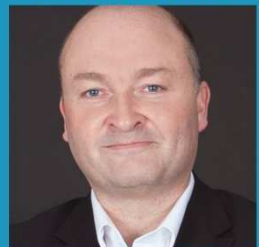
LEDER FORENINGEN FAR OG NORDIC FATHERS