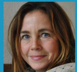
PROFESSOR OG BARNEPSYKOLOG